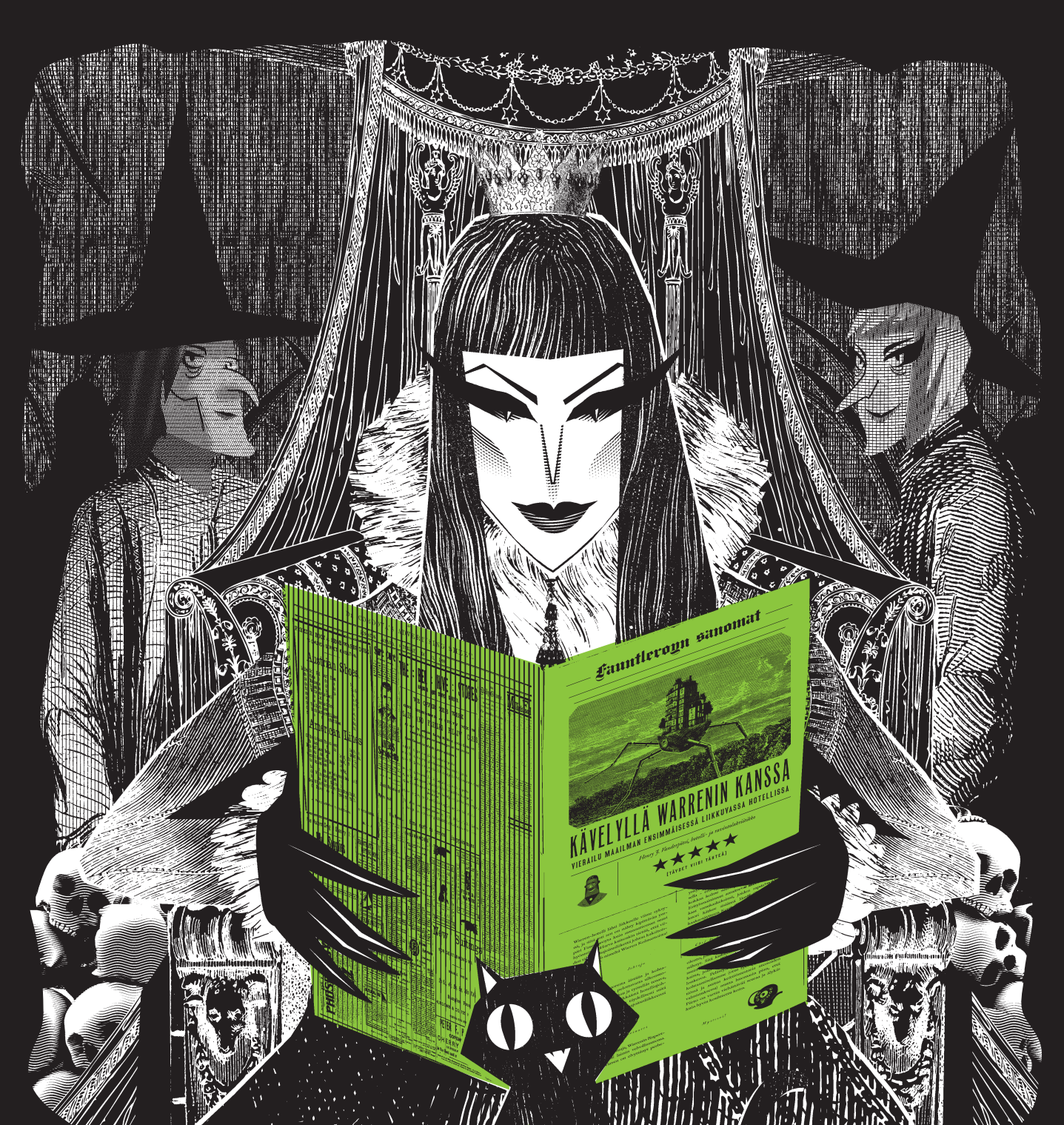
Tania del Rio – Will Staehle (kuv.): Warren 13. ja kuiskausten metsä Näytesivut kirjasta © Kumma-kustannus & tekijät