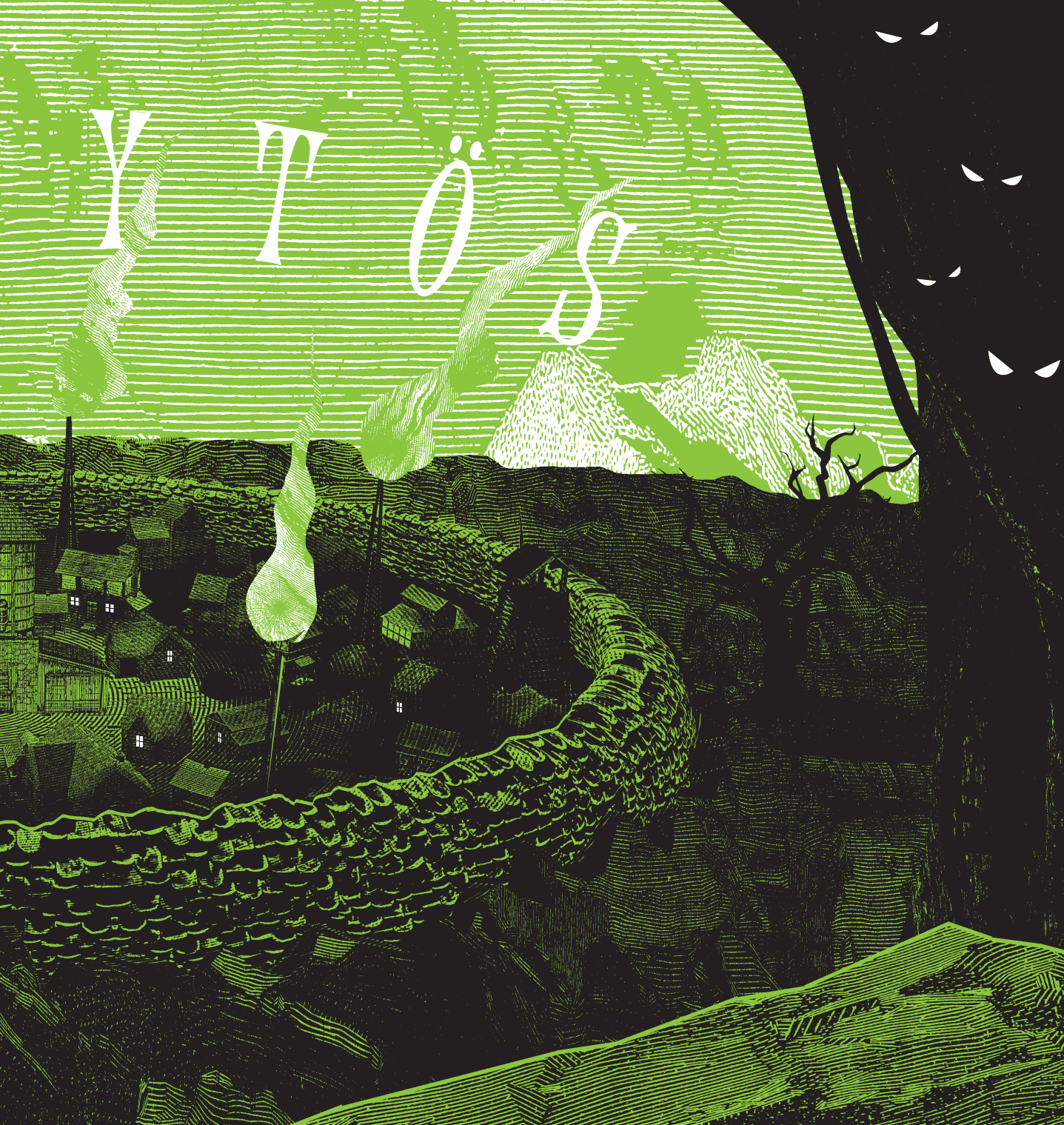
Tania del Rio – Will Staehle (kuv.): Warren 13. ja kuiskausten metsä Näytesivut kirjasta © Kumma-kustannus & tekijät