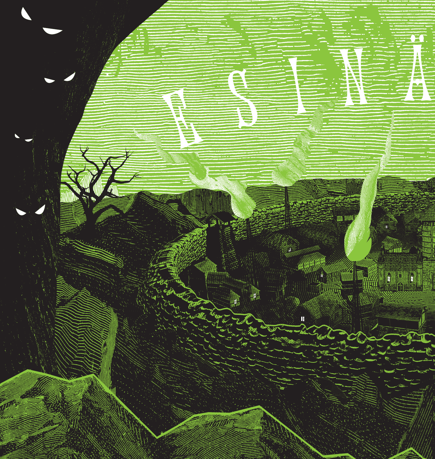
Tania del Rio – Will Staehle (kuv.): Warren 13. ja kuiskausten metsä Näytesivut kirjasta © Kumma-kustannus & tekijät